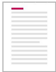
Bovenaan Rust op de tekst Linkslijnend