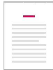
Op de derde regel Zwevend Gecentreerd