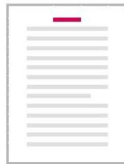
Bovenaan Rust op de tekst Gecentreerd