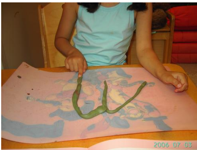
Tot en met het eind van de letter.