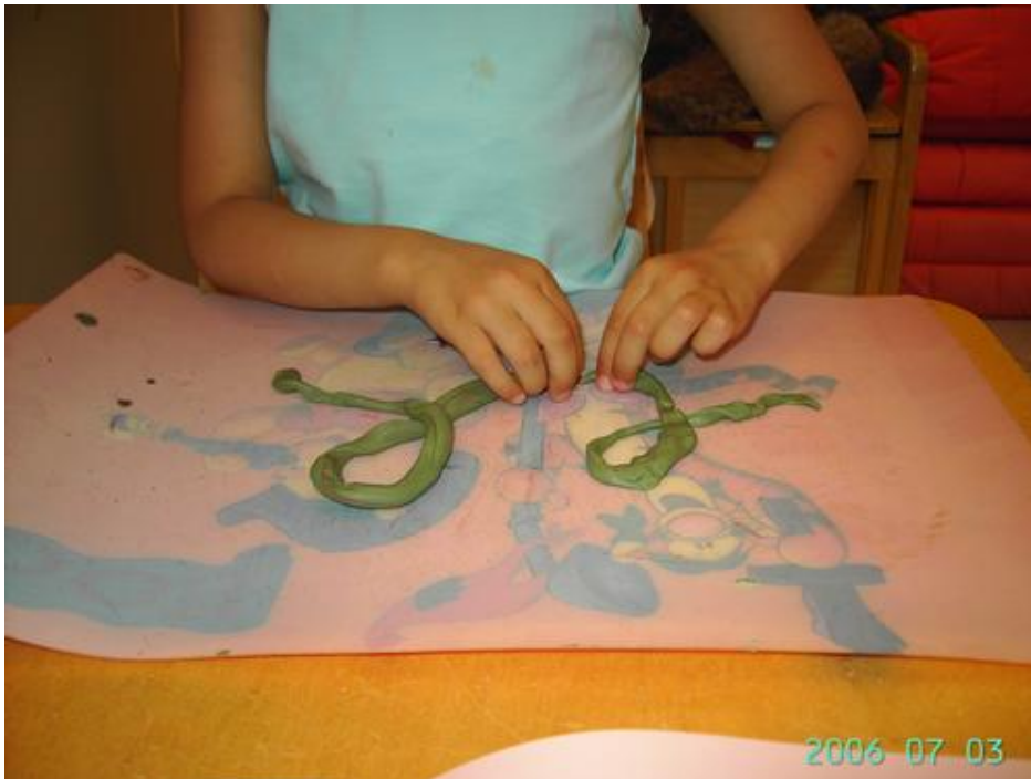
Een 'ee' leggen met klei.