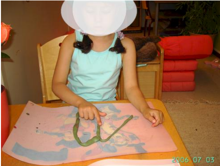
Het traject van de 'n' nalopen met de vinger.